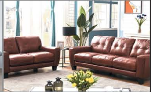
Sofa + Loveseat $1595 Genuine Leather Set +No Tax!