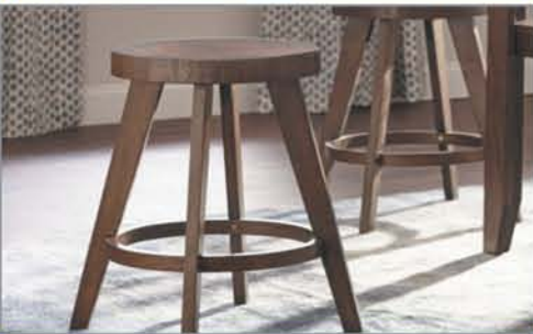
24" Barstools (2) $125 Set of 2 +No Tax!