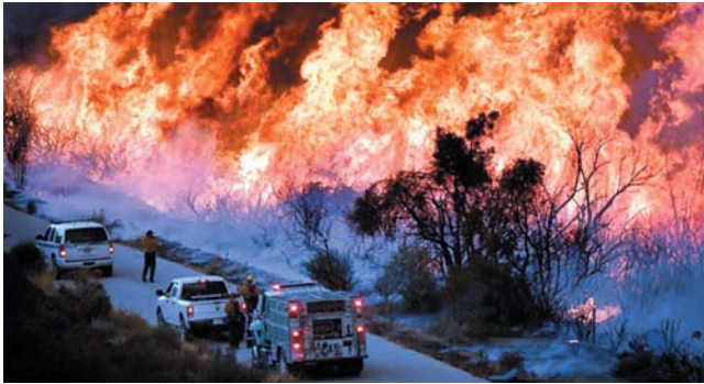
ਕੈਲੀਫੋਰਨੀਆ ਦੇ ਜੰਗਲਾਂ 'ਚ ਲੱਗੀ ਅੱਗ।

ਕੈਲੀਫੋਰਨੀਆ, (ਨੀਟਾ/ ਕੁਲਵੰਤ/ ਪੰਜਾਬ ਮੇਲ)- ਸੋਕੇ, ਗਰਮੀ ਅਤੇ ਖੁਸ਼ਕ ਮੌਸਮ ਦੇ ਚੱਲ ਰਿਹਾ ਅਮਰੀਕਾ ਦੀਆਂ ਤਕਰੀਬਨ 11 ਪੱਛਮੀ ਸਟੇਟਾਂ 'ਚ ਭਿਆਨਕ ਜੰਗਲੀ ਅੱਗ ਨੇ ਤਬਾਹੀ ਮਚਾਈ ਹੋਈ ਹੈ। ਇਨ੍ਹਾਂ ਅੱਗਾਂ ਵਿਚ ਤਕਰੀਬਨ 6.7 ਮਿਲੀਅਨ ਏਕੜ ਜੰਗਲ ਸੜਕੇ ਸਵਾਹ ਹੋ ਗਿਆ ਅਤੇ ਤਕਰੀਬਨ 35 ਲੋਕਾਂ ਦੇ ਮਾਰੇ ਜਾਣ ਦੀਆਂ ਖਬਰਾਂ ਆ ਰਹੀਆਂ ਹਨ ਅਤੇ ਡੇਢ ਦਰਜਨ ਦੇ ਕਰੀਬ ਲੋਕ ਲਾਪਤਾ ਵੀ ਦੱਸੇ ਜਾ ਰਹੇ ਹਨ। ਇਸ ਭਿਆਨਕ ਅੱਗ ਵਿਚ ਸੈਂਕੜੇ ਘਰ, ਦਰਜਨਾਂ ਦੇ ਹਿਸਾਬ ਨਾਲ ਬਿਜ਼ਨਸ ਸੜਕੇ ਸਵਾਹ ਹੋ ਗਏ। ਇਕੱਲੇ ਕੈਲੀਫੋਰਨੀਆ ਵਿਚ ਤਕਰੀਬਨ ਸਾਢੇ ਤਿੰਨ ਮਿਲੀਅਨ ਏਕੜ ਸੜੇ ਹਨ, ਅਤੇ ਦੋ ਦਰਜਨ ਦੇ ਕਰੀਬ ਲੋਕੀ ਮਾਰੇ ਗਏ ਹਨ। ਲੱਖਾਂ ਦੇ ਹਿਸਾਬ ਨਾਲ ਲੋਕਾਂ ਨੂੰ ਸੁਰੱਖਿਅਤ ਥਾਂਵਾਂ 'ਤੇ ਪਹੁੰਚਾਇਆ ਗਿਆ ਹੈ। ਦੂਸਰੀ ਸਟੇਟ ਜਿੱਥੇ ਜ਼ਿਆਦਾ ਨੁਕਸਾਨ ਹੋਇਆ ਹੈ, ਉਹ ਹੈ ਔਰੇਗਨ, ਇੱਥੇ 960,000 ਏਕੜ ਸੜੇ ਦੱਸੇ ਜਾ ਰਹੇ ਹਨ ਤੇ ਦਰਜਨ ਦੇ ਕਰੀਬ ਲੋਕਾਂ ਦੇ ਮਾਰੇ ਜਾਣ ਦਾ ਖ਼ਦਸ਼ਾ ਹੈ। ਇਸੇ ਤਰ੍ਹਾਂ ਵਾਸ਼ਿੰਗਟਨ ਸਟੇਟ ਵਿਚ 640,000 ਏਕੜ ਸੜੇ