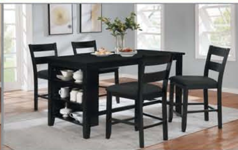
5 Pc. Dining Set $545 Bar Table, 4 Chairs +No Tax!