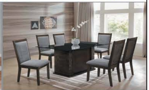
7 Pc. Dining Set $985 Table, 6 Chairs +No Tax!