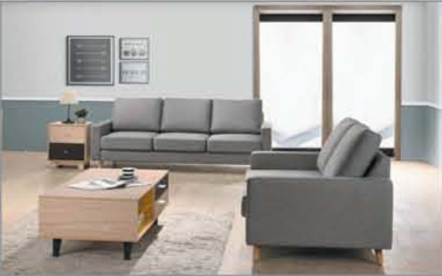
Sofa + Loveseat $495 2 Pc. Set