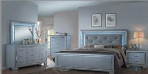
4 Pc. Queen Set $1495 Q. Bed, Dresser, Mirror, NS