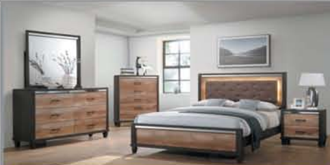
4 Pc. Queen Set $695 Q. Bed, Dresser, Mirror, NS