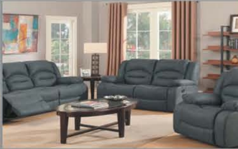
Sofa + Loveseat $1345 2 Pc. Set / Recliner Available +No Tax!