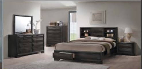
4 Pc. Queen Set $1095 Q. Bed, Dresser, Mirror, NS +No Tax!