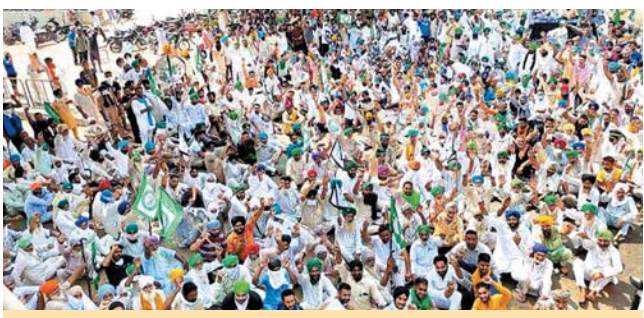
ਮਹਿਲ ਕਾਂ ਵਿਖੇ ਲੁਧਿਆਣਾ-ਬਠਿੰਡਾ ਮੁੱਖ ਸੜਕ ਜਾਮ ਕਰਕੇ ਲਗਾਏ ਵਿਸ਼ਾਹ ਧਰਨੇ ਦੌਰਾਨ ਕੇਂਦਰ ਸਰਕਾਰ ਵਿਰੁੱਧ ਨਾਅਰੇਬਾਜ਼ੀ ਕਰਦੇ ਹੋਏ ਕਿਸਾਨ।

ਚੰਡੀਗੜ੍ਹ, (ਪੰਜਾਬ ਮੇਲ)- ਖੇਤੀ ਆਰਡੀਨੈਂਸਾਂ ਖ਼ਿਲਾਫ ਪੰਜਾਬ ਭਰ 'ਚ ਕਿਸਾਨਾਂ ਦੇ ਰੋਹ ਭਰਪੂਰ ਨਾਅਰੇ ਗੂੰਜੇ। ਸੰਸਦ ਦੇ ਮੌਨਸੂਨ ਇਜਲਾਸ 'ਚ ਪੇਸ਼ ਇਨ੍ਹਾਂ ਖੇਤੀ ਆਰਡੀਨੈਂਸਾਂ ਨੂੰ ਕਿਸਾਨਾਂ ਨੇ ਸੜਕਾਂ 'ਤੇ ਉਤਰ ਕੇ ਰੋ ਕਰ ਦਿੱਤਾ। ਦਰਜਨਾਂ ਕਿਸਾਨੀ ਧਿਰਾਂ ਨੇ ਵੱਖ-ਵੱਖ ਥਾਵਾਂ ਉੱਤੇ ਜਰਨੈਲੀ ਸੜਕਾਂ 'ਤੇ ਪਰਨੇ ਲਾ ਕੇ ਆਵਾਜ਼ਾਈ ਠੱਪ ਕੀਤੀ। ਉਨ੍ਹਾਂ ਤਿੰਨ ਦਰਿਆਈ ਪੁਲਾਂ ਨੂੰ ਵੀ ਰੋਕਿਆ।