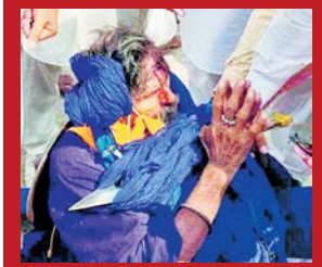
ਹਿੰਮਤ ਸਾਹਿਬ ਕੰਧਲੈਕਸ 'ਚ ਹੋਈ ਝਗੜੇ ਦੌਰਾਨ ਜ਼ਖ਼ਮੀ ਹੋਇਆ ਇੱਕ ਨਿਹੰਗ ਸਿੰਘ।

ਪਰਨਾ ਦੂਜੇ ਦਿਨ ਵੀ ਜਾਰੀ ਰਿਹਾ ਅਤੇ ਸ਼੍ਰੋਮਣੀ ਕਮੇਟੀ ਅਤੇ ਪਰਨਾਕਾਰੀਆਂ ਦੇ ਆਗੂਆਂ ■ ਬਾਕੀ ਖਬਰ ਸਫਾ 28 'ਤੇ