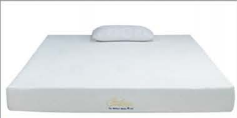
8" Gel Memory $295 Foam Mattress - Queen