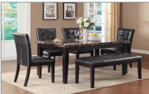
6 Pc. Dining Set $495 Table, 4 Chairs, Bench