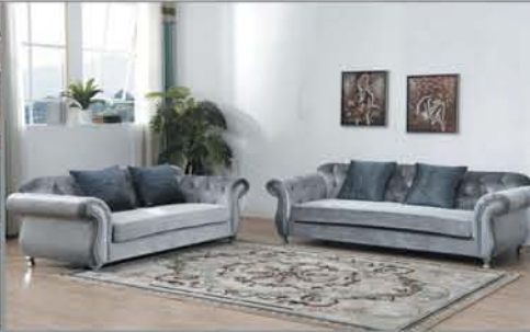
Sofa + Loveseat $1595 2 Pc. Set / Chair Available +No Tax!